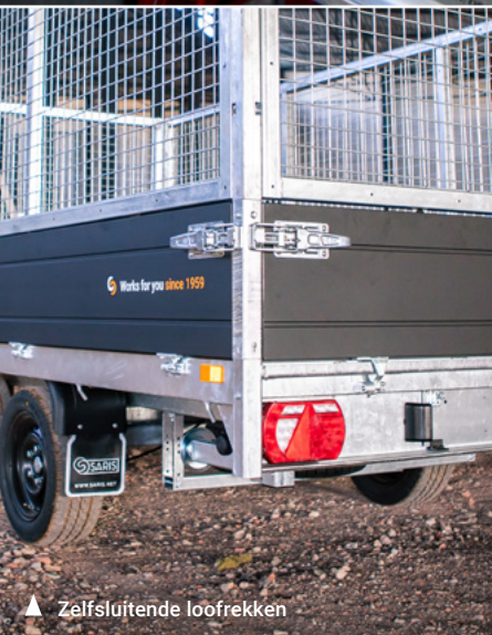
▲ Zelfsluitende loofrekken