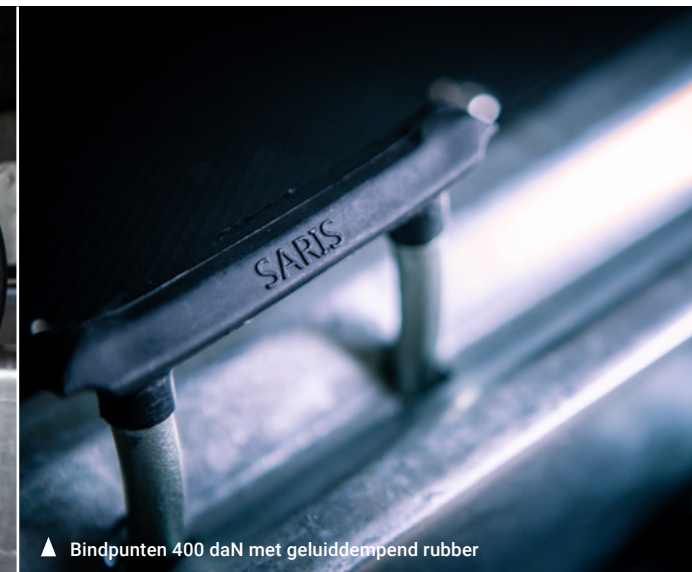
▲ Bindpunten 400 daN met geluiddempend rubber