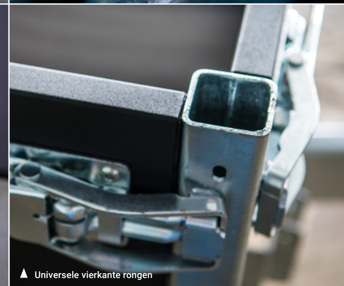
▲ Universele vierkante rongen