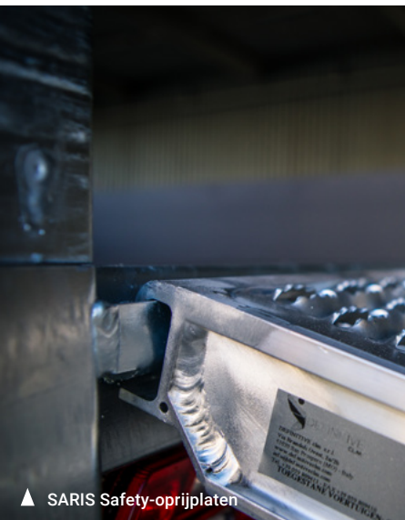
▲ SARIS Safety-oprijplaten