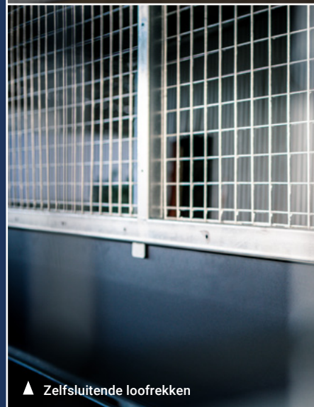
▲ Zelfsluitende loofrekken