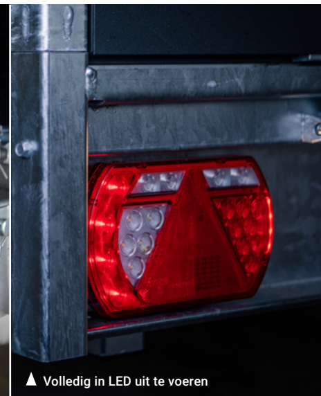
▲ Volledig in LED uit te voeren