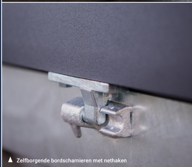
▲ Zelfborgende bordscharnieren met nethaken