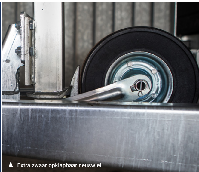
▲ Extra zwaar opklapbaar neuswiel